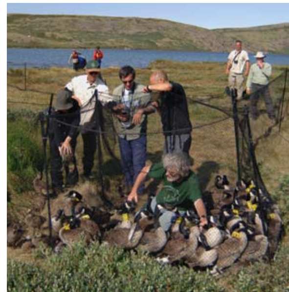
Fangstfolden er fuld.