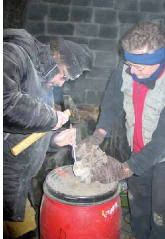
Eske Willerslev bruger stort set al sin tid på at udforske verden og finde nye sandheder om fortidens dyre- og planteliv. På billedet er han sammen med en kollega i gang med at gøre moskusokse-knogler klar til dna-analyse i Taimyr i Sibirien.

- Jeg har meget stor gavn af at arbejde så tæt på iskerneforskerne. Der er bare nogle informationer, man ikke får, hvis man ikke drikker kaffe sammen og tager en sludder på gangen. Og så er det jo generelt inspirerende at sidde så tæt på